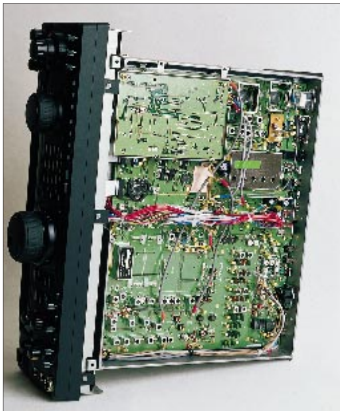
Nach Abnahme des unteren Gehäusedeckels sind das 2,4-kHz-Quarzfilter auf der ZF von 8,215 MHz sowie die zwei unbelegten Steckplätze für das AM- und das CW-Filter zu erkennen.

Nichtsdestotrotz schätzte ich die guten HF-Eigenschaften zusammen mit den vielen gut handhabbaren Bedienungsdetails des Transceivers. Zu letzterem trägt ein Menüsystem bei, mit dem sich die meisten der 73 Funktionen inklusive VFO-Abstimmungsgeschwindigkeit, Peak-Hold-Messungen, Trägerersatz für LSB und USB