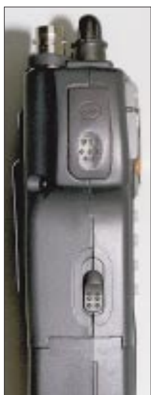
Die zierliche Sendetaste ist durch eine Mulde doch gut zu ertasten. Darüber die unverzichtbare Zweitfunktionstaste.

(* – AM, sonst FM) (c) uf, Irrtümer vorbehalten