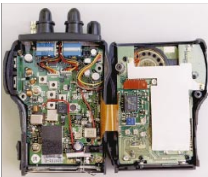
Nach dem Lösen von nur vier Schrauben läßt sich das Gerät bequem aufklappen.