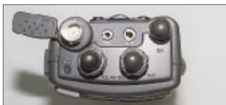
Ansicht von oben: BNC- und abdeckbare Klinkenbuchsen, Hauptabstimmknopf und koaxial angeordnete Drehsteller für Lautstärke und Rauschsperrleuchte plus „S/E-Leuchtdiode“ prägen das Bild.