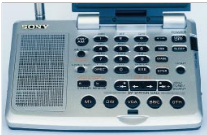
Das übersichtliche Tastenfeld des ICF-SW07 ermöglicht trotz der geringen Ausmaße des Empfängers eine komfortable Bedienung, so z.B. direkte Frequenz-eingabe. Das Bedienungs-konzept gleicht dem anderer Weltempfänger aus dem Hause Sony.

Dem Empfang von UKW- und Kurzwellensendern dient zunächst einmal die 67 cm