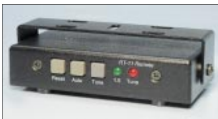
Bild 4: Das Original-LDG-Remote Head Kit. Der mitgelieferte Monatgebügel erlaubt u.a. auch die Befestigung auf der Armaturentafel eines Autos.

Etwa Geschick und wirkliche Mühen erfordern dabei allein die Herstellung des Übertragers und das Bewickeln der Ringkerne, wobei man den Wickelsinn unbedingt beachten muß. Das Verbindungskabel